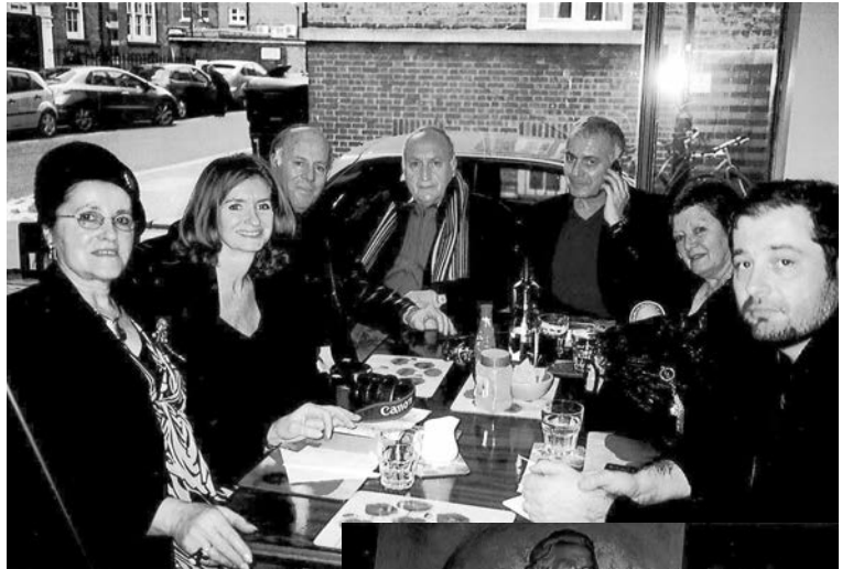
La délégation présente à Londres

L'associu I Fochi Paoli, cher au président Jacques Luciani, a reçu récemment un personnage illustre tout droit débarqué de Pennsylvanie, et plus précisément de «Paoli City». Un événement qui s'inscrit dans la continuité des efforts de cette association pour internationaliser la mémoire du «babbu di a patria».