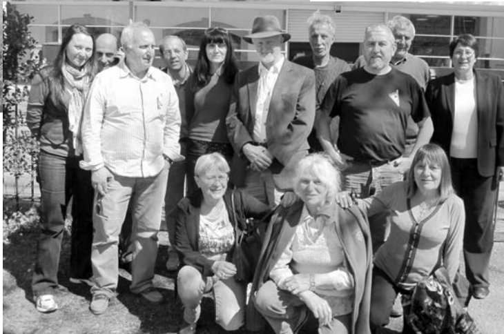
L'éminent visiteur entouré des membres de l'association